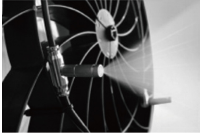
トルネード送風&ミスト噴霧